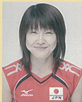
● 多治見 麻子(たじみ あさこ)

1972 6月生まれ、東京都出身 1992：バルセロナオリンピック出場 1996：アトランタオリンピック出場 2008：北京オリンピックに出場 2012：現役引退